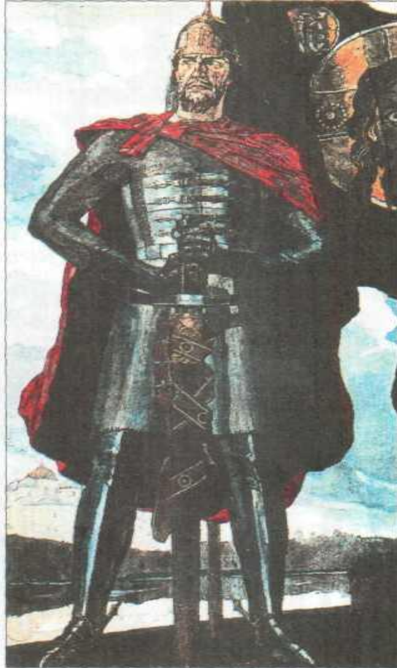
П. Корин. Александр Невский.