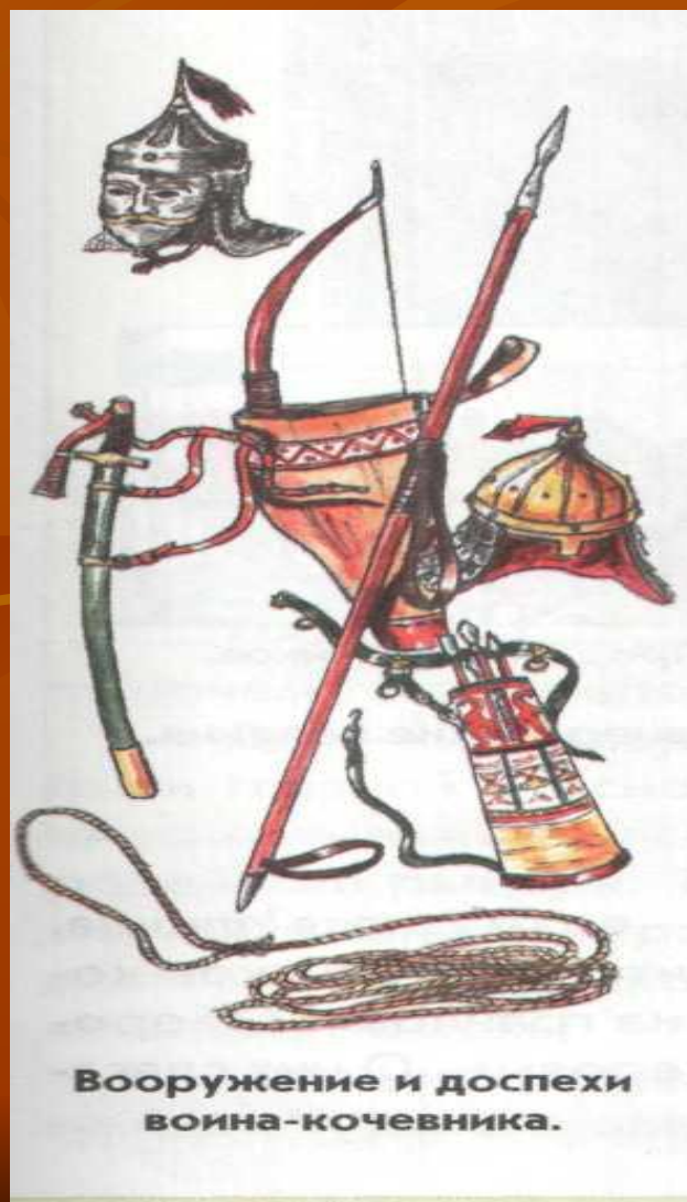
Вооружение и доспехи воина-кочевника.

Со времён Древней Руси жителям нашей страны часто приходилось защищать родную землю от врагов