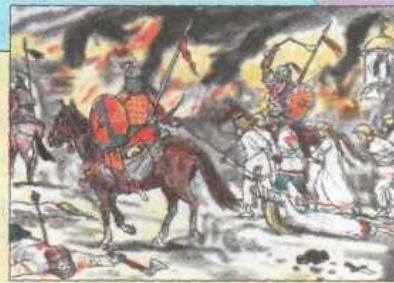
Набег на русское селение.