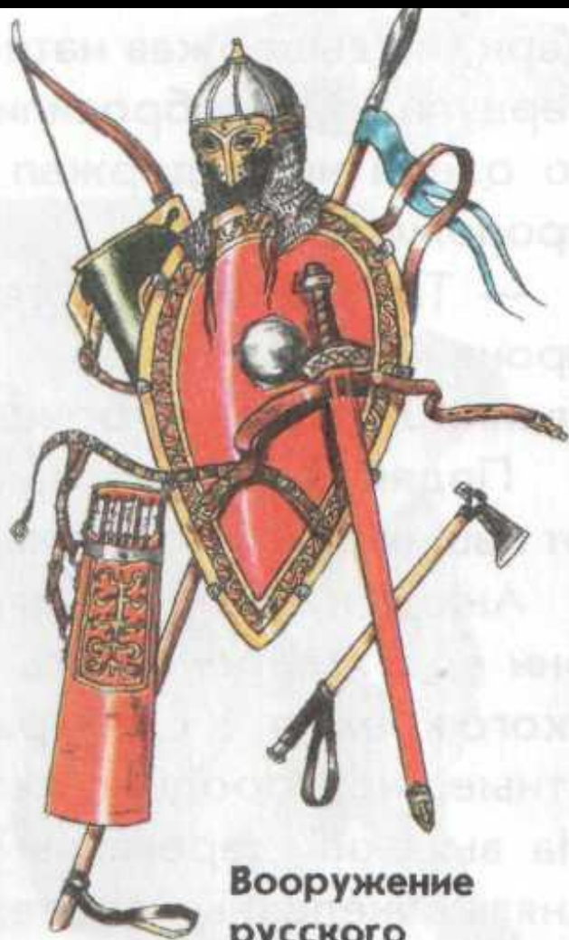
Вооружение русского дружинника.