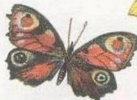
Дневной павлиний глаз