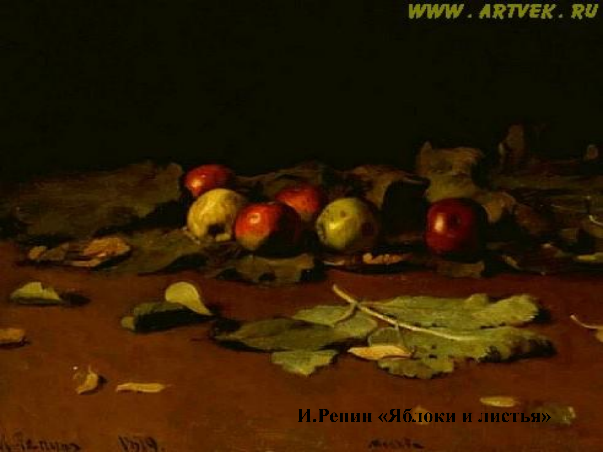
И.Репин «Яблоки и листья»