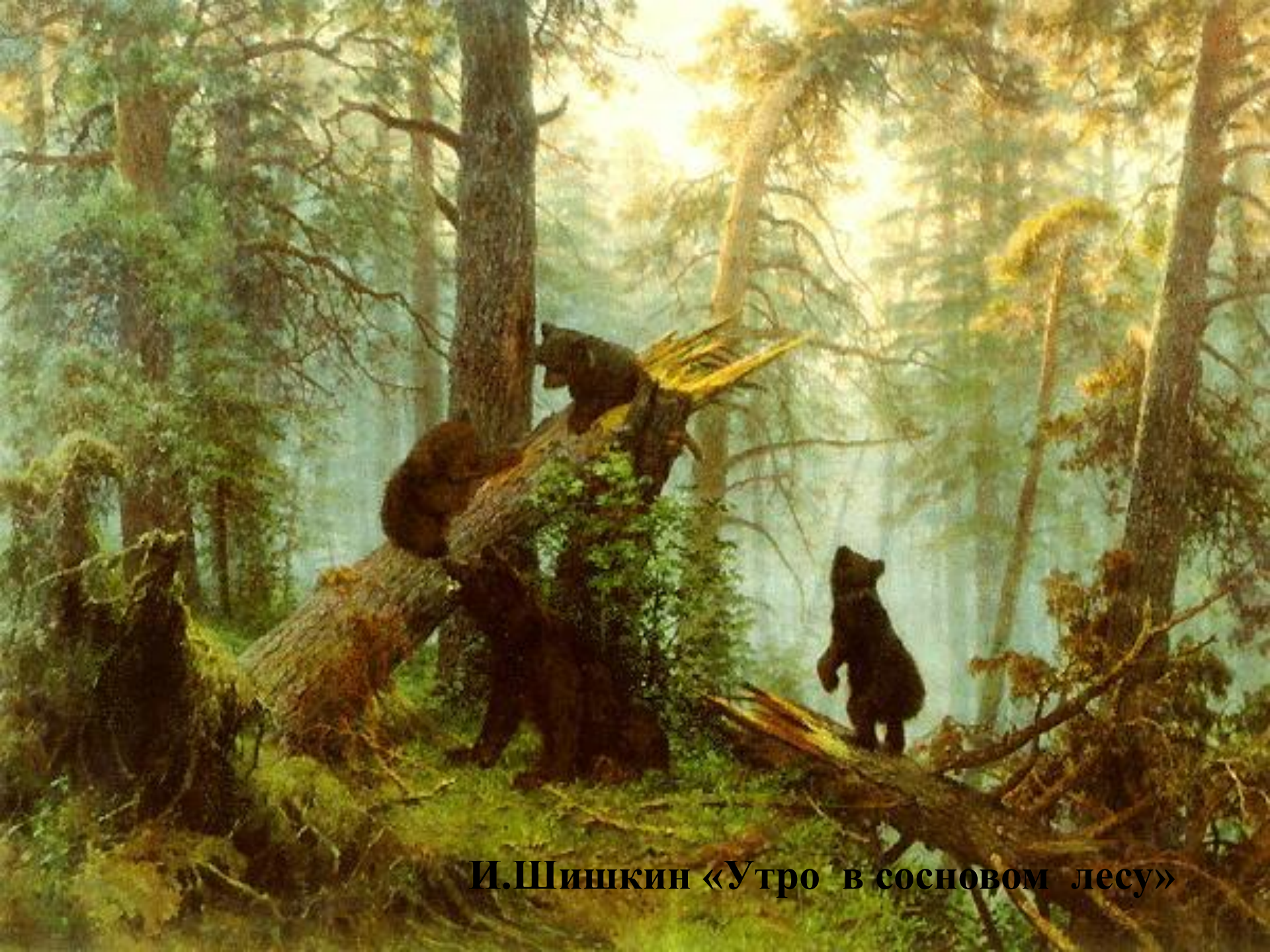
И.Шишкин «Утро в сосновом лесу»