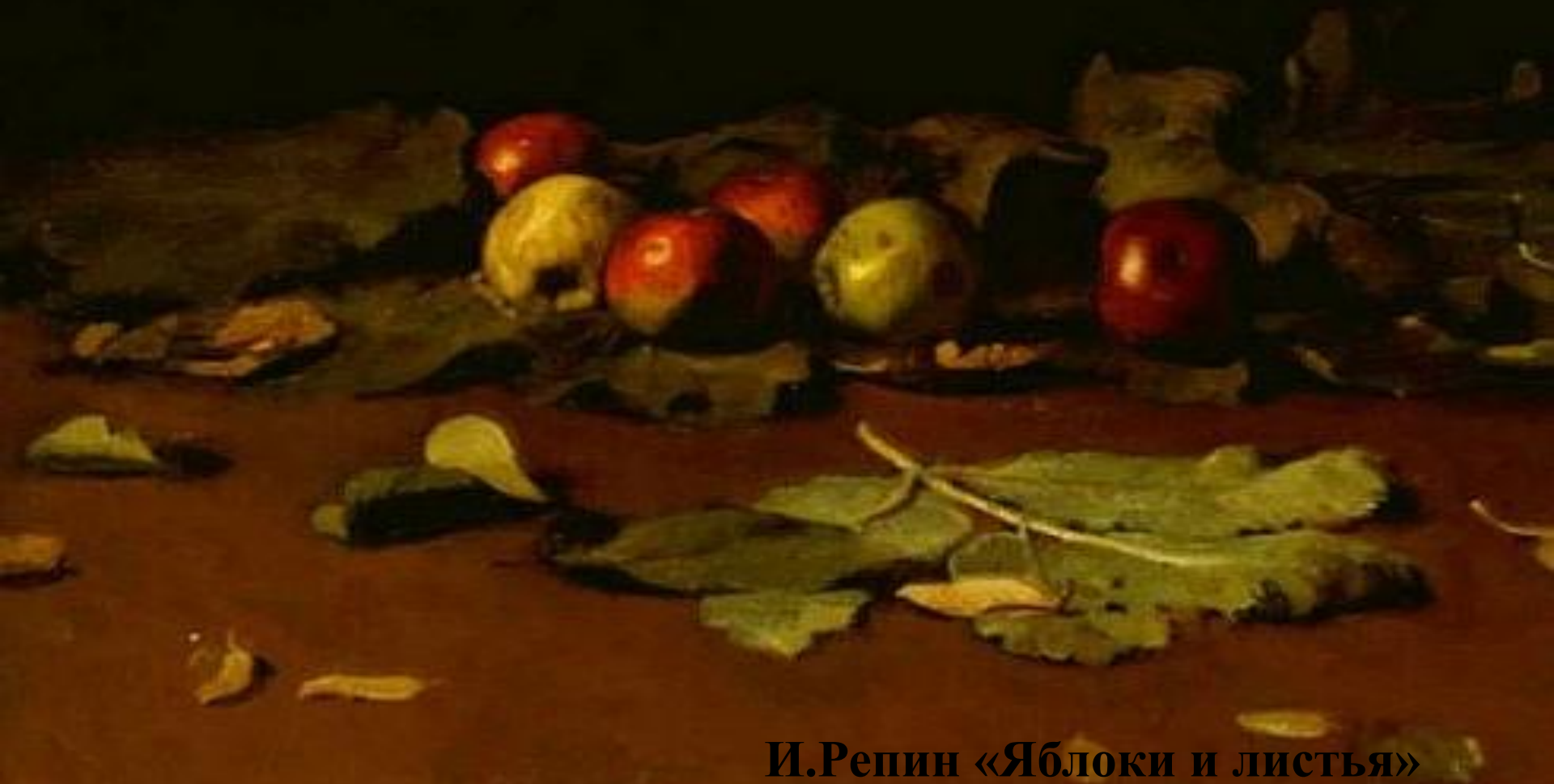
И.Репин «Яблоки и листья»