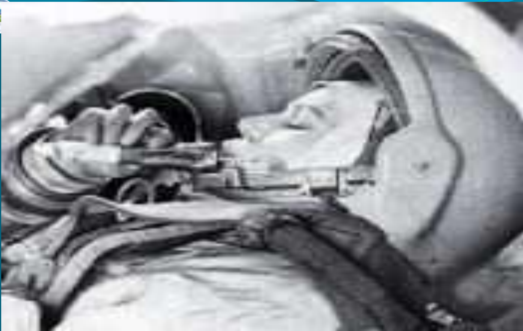
Валентина Терешкова принимает пищу из тубы