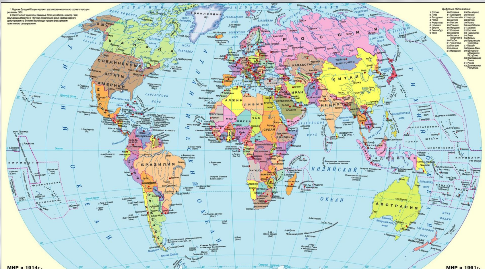
МИР в 1914г.