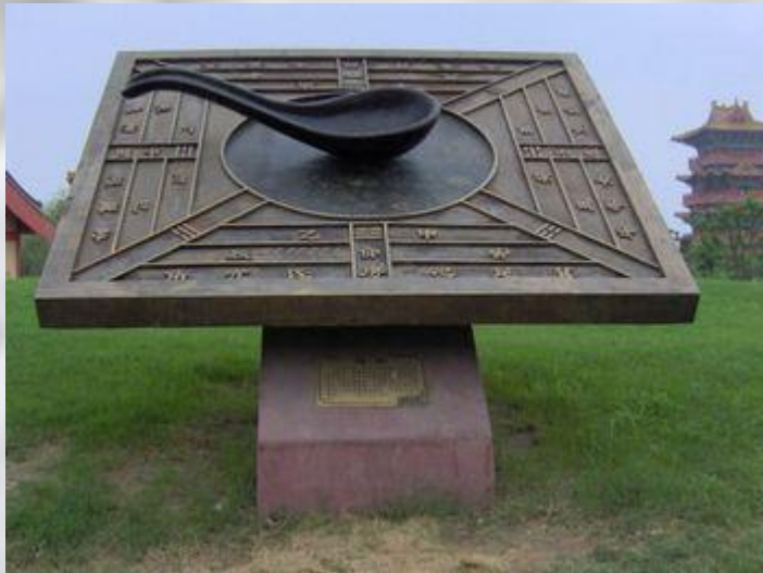
Модель китайского компаса