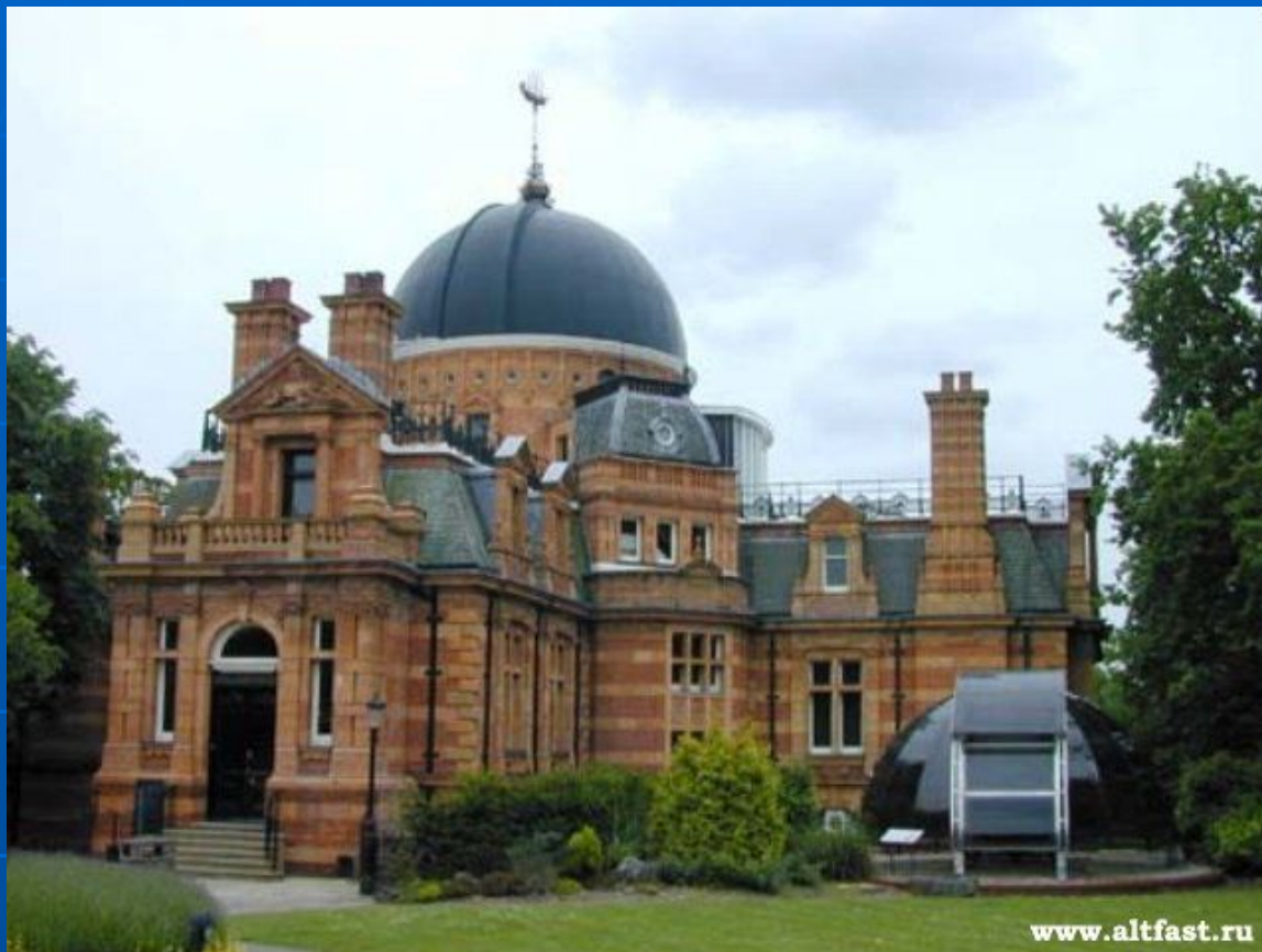
Королевская обсерватория в Гринвиче