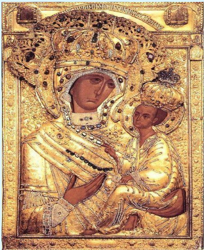
ИКОНА ВСЕХ СКОРБЯЩИХ РАДОСТЬ