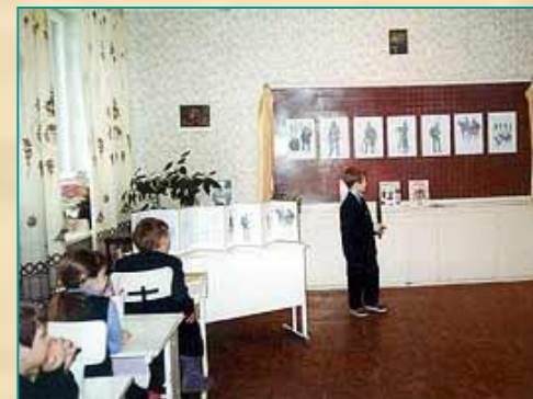
Средняя школа № 5, г. Петрозаводск