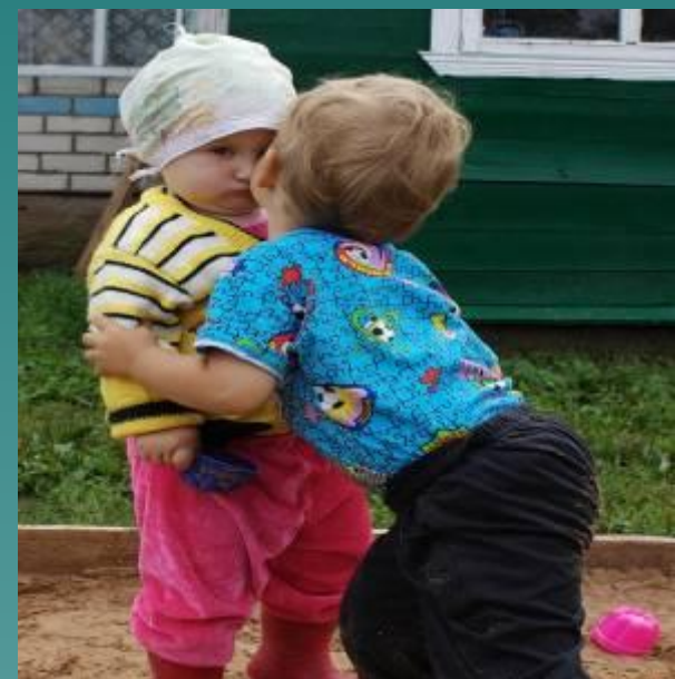
Два ребёнка Двое детей