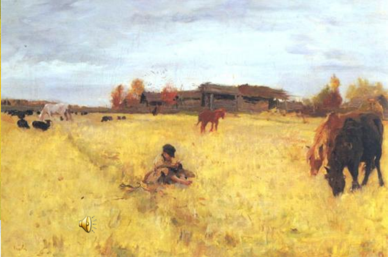
И.И. Левитана "Золотая осень"