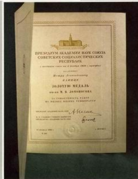
Диплом за работу по физике им. М.В.Ломоносова П.Л.Капицы

В 1956 году постановлением Совета Министров СССР была учреждена золотая медаль и премия имени М.В.Ломоносова.