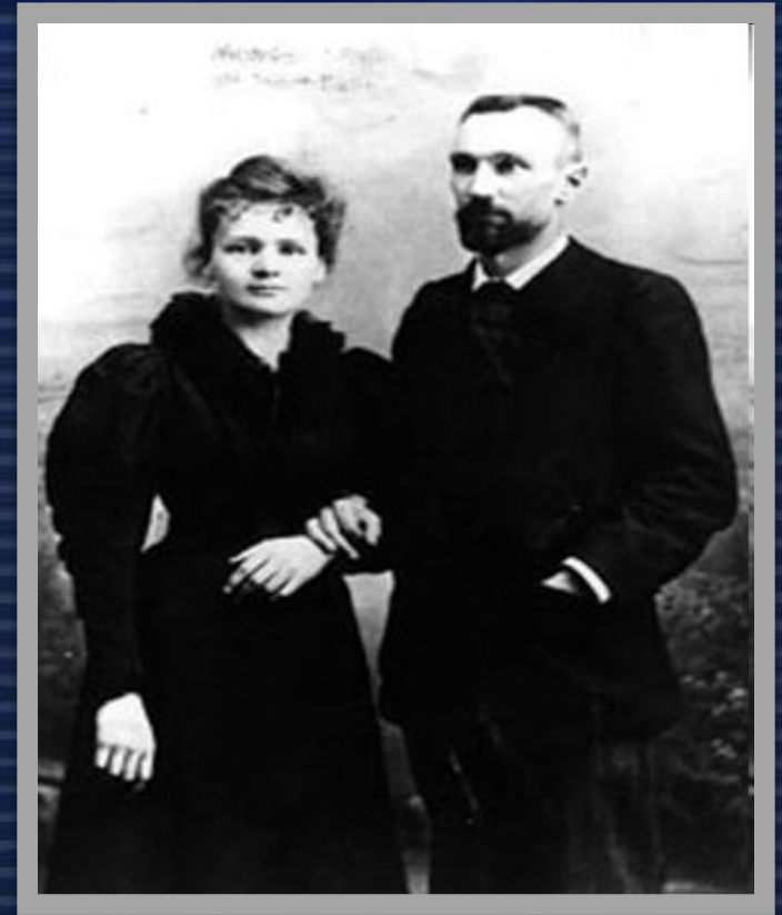
Мария Склодовская-Кюри и Пьер Кюри