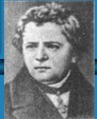
Ом Георг Симон (1787-1854 гг.) немецкий физик