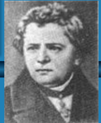
Ом Георг Симон (1787-1854 гг.) немецкий физик