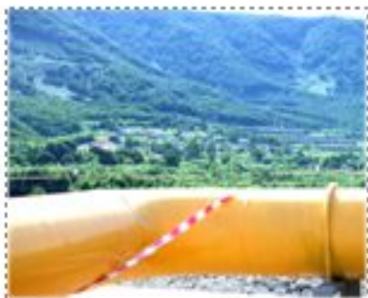
Первый запуск Мутновской ГЭС

Сегодня наша планета стоит на пороге экологической катастрофы и наиболее грозный предвестник ее – парниковый эффект. Он вызван увеличением содержания в атмосфере углекислого газа, который образуется в огромных количествах при сжигании топлива. Того самого топлива, которое используется для обеспечения наших квартир светом, теплом и водой. Значит, судьба нашей планеты зависит от каждого из нас, от всего человечества, а вернее, от того, сколько мы потребляем природных ресурсов и как экономим то, что даёт нам природа!