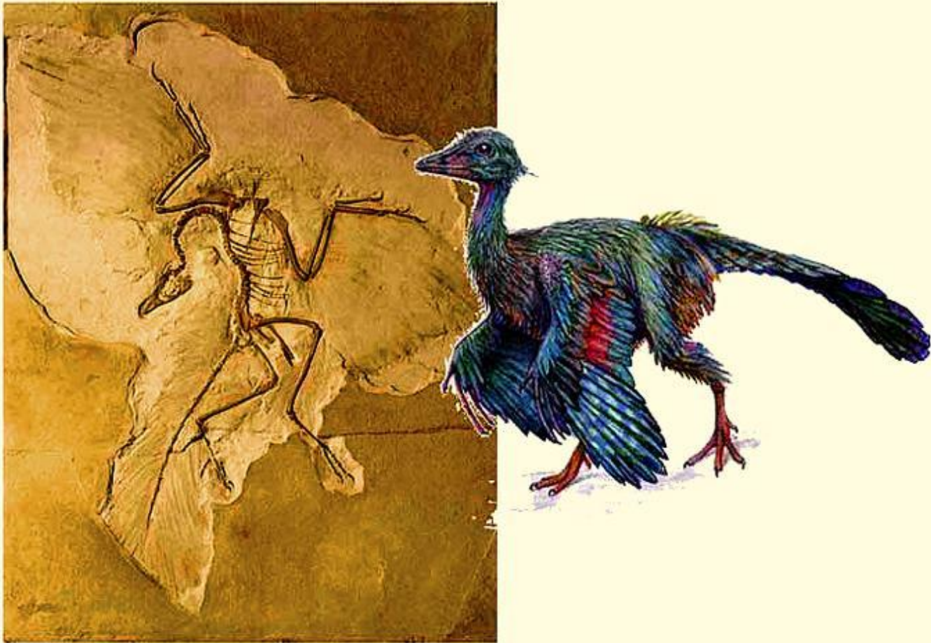
Археоптерикс- древняя вымершая птица, предок современных ПТИЦ