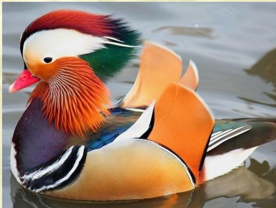
Мандаринка - охраняемая птица