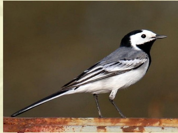
Белая трясогузка-2011 год