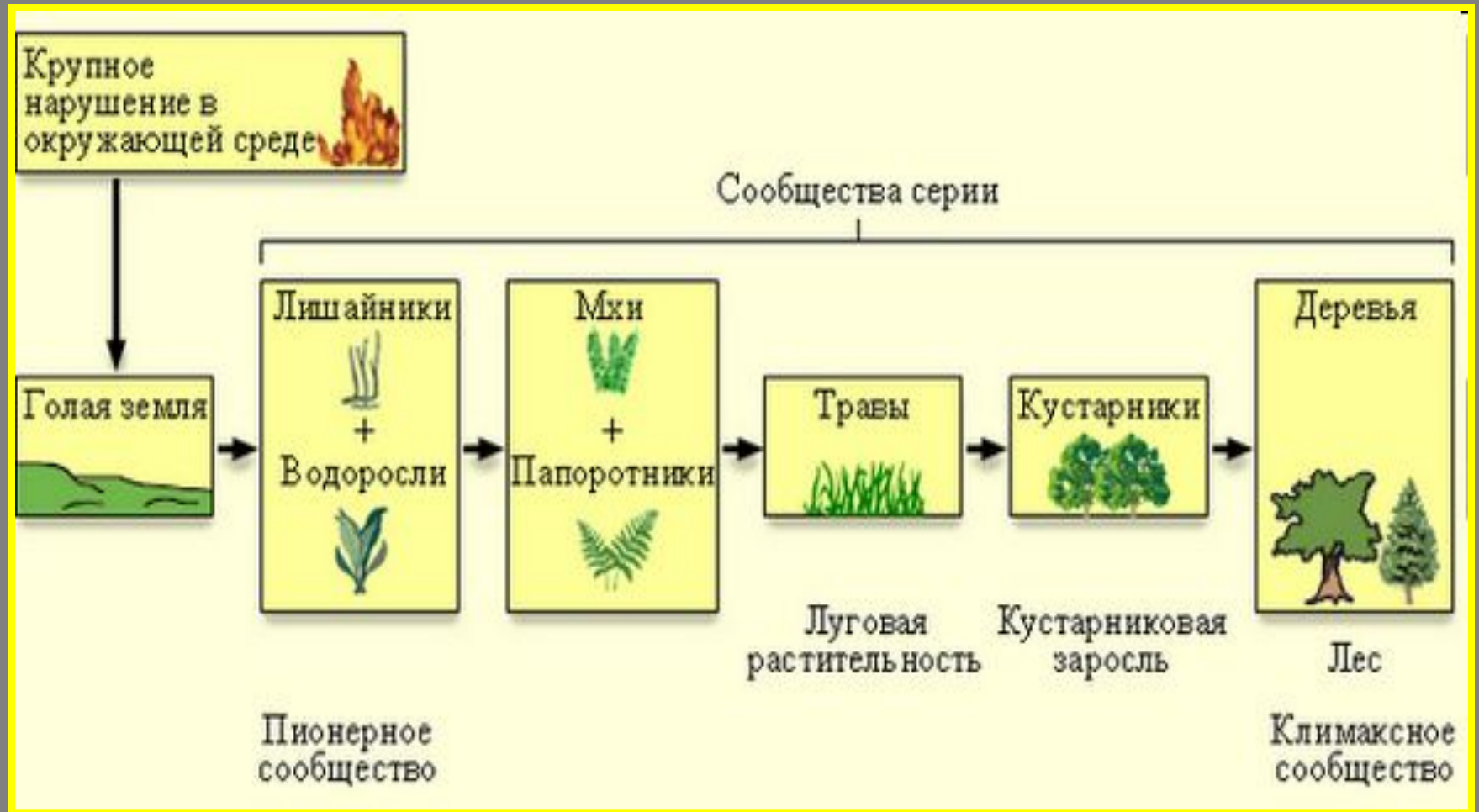
Схема типичной наземной растительности