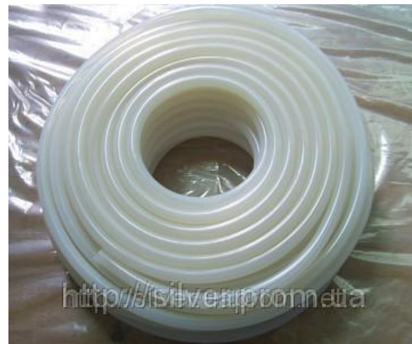
Шланг силиконовый термостойкий