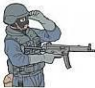
СМОТРИ / Я ВИЖУ