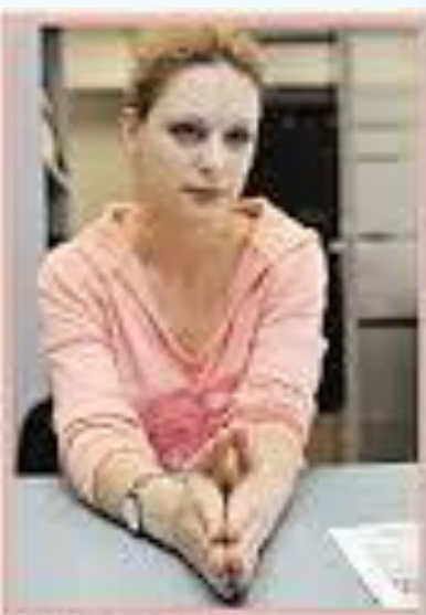
Внимательно слушает, интерес.