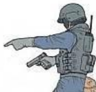
ТАМ / ТУДА