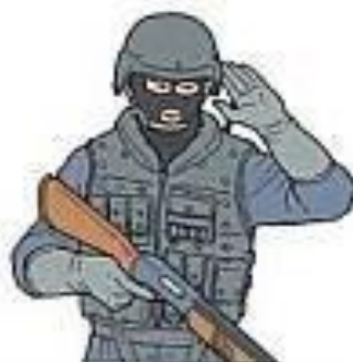
СЛУШАЙ / Я СЛЫШУ