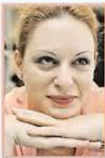
Красуется, хочет понравиться.