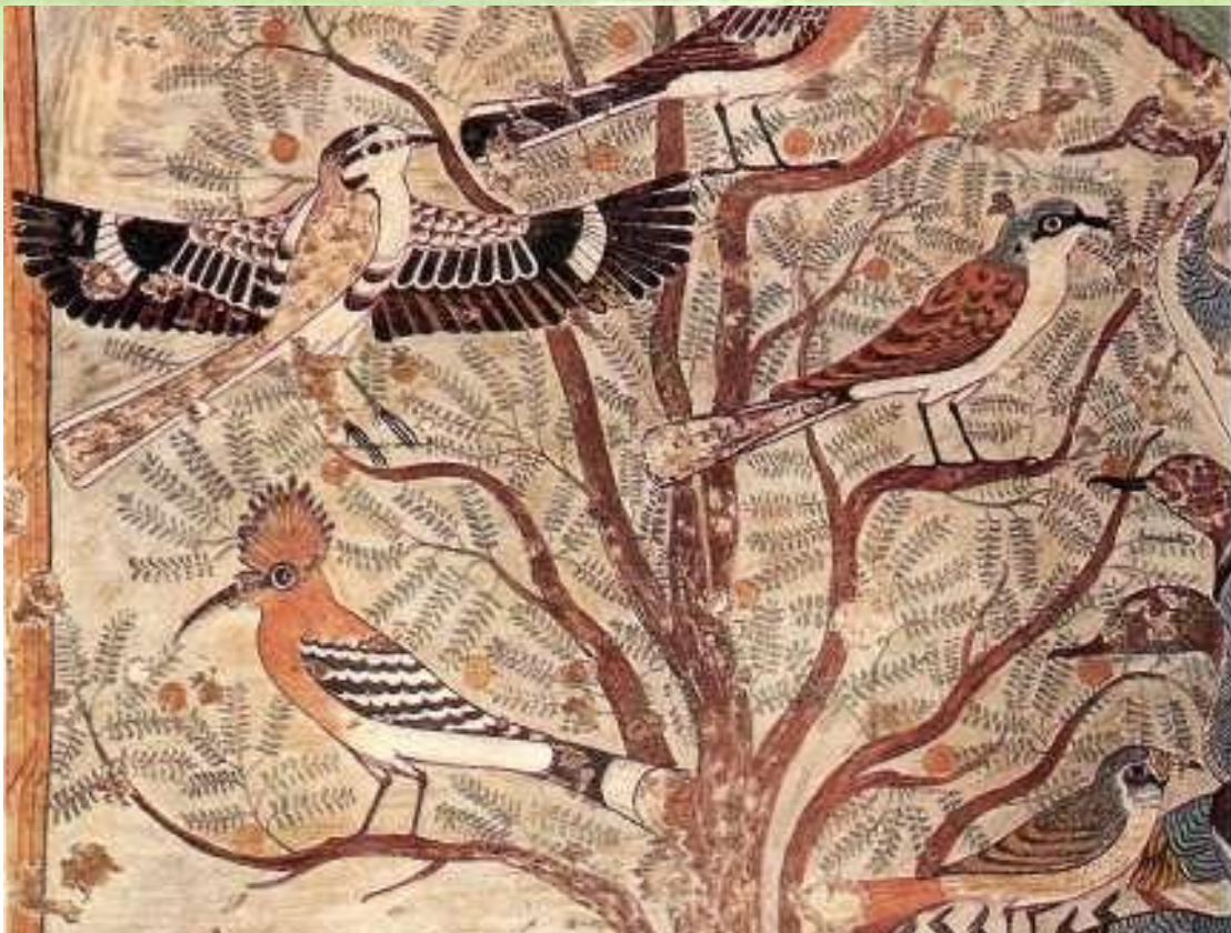
Деталь росписи гробницы Хнумхотепа в Бени-Гасане .