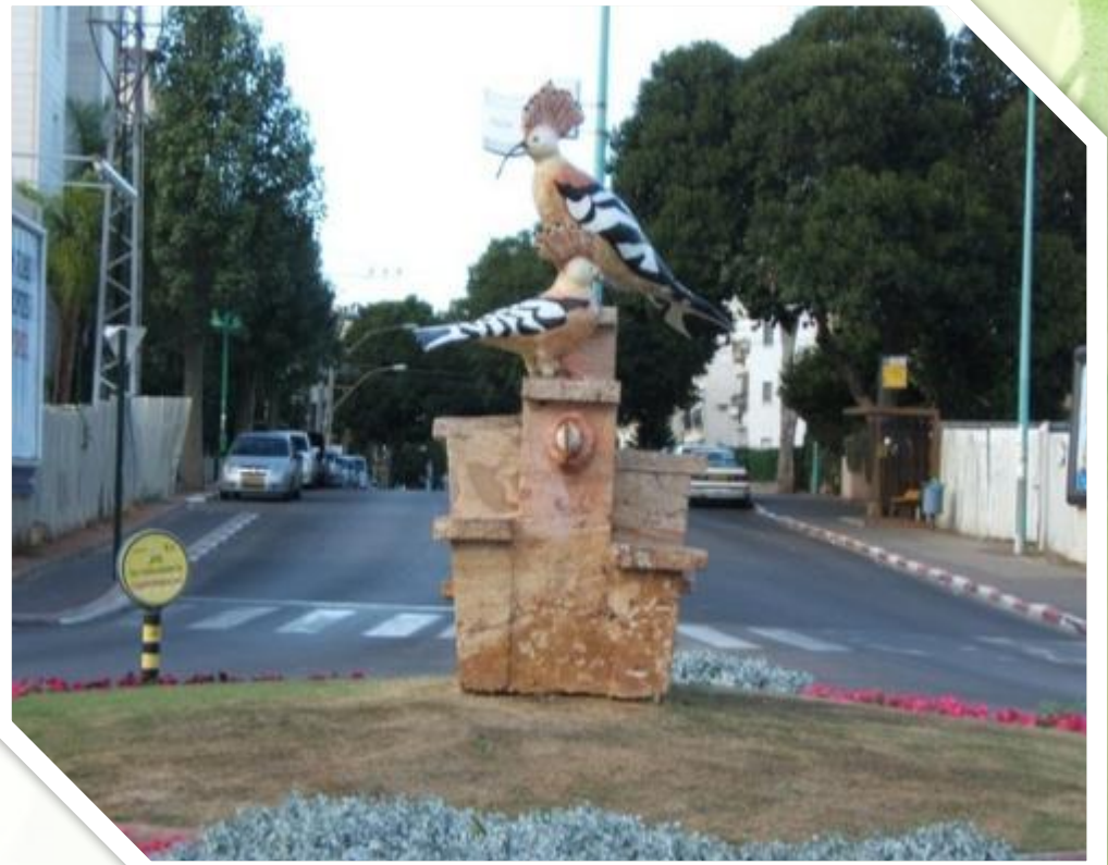
Памятник удо́ду на ул. Ротшильд в Петах Тикве.

В Израиле в результате всенародного голосования в 2008 году удо́д избран национальным символом этой страны.