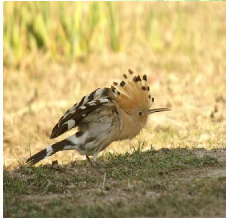
Возмущенный удод.

Характерной особенностью удода является хохолок на темени. Обычно он сложен, но когда эта птица чем-нибудь напугана или нервничает, она распахивает его в виде веера.