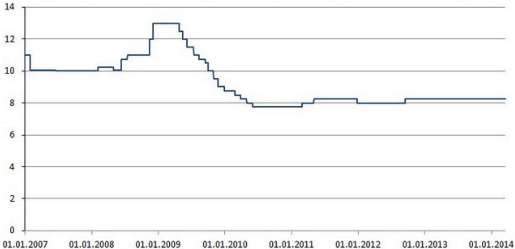
График ставки рефинансирования в России