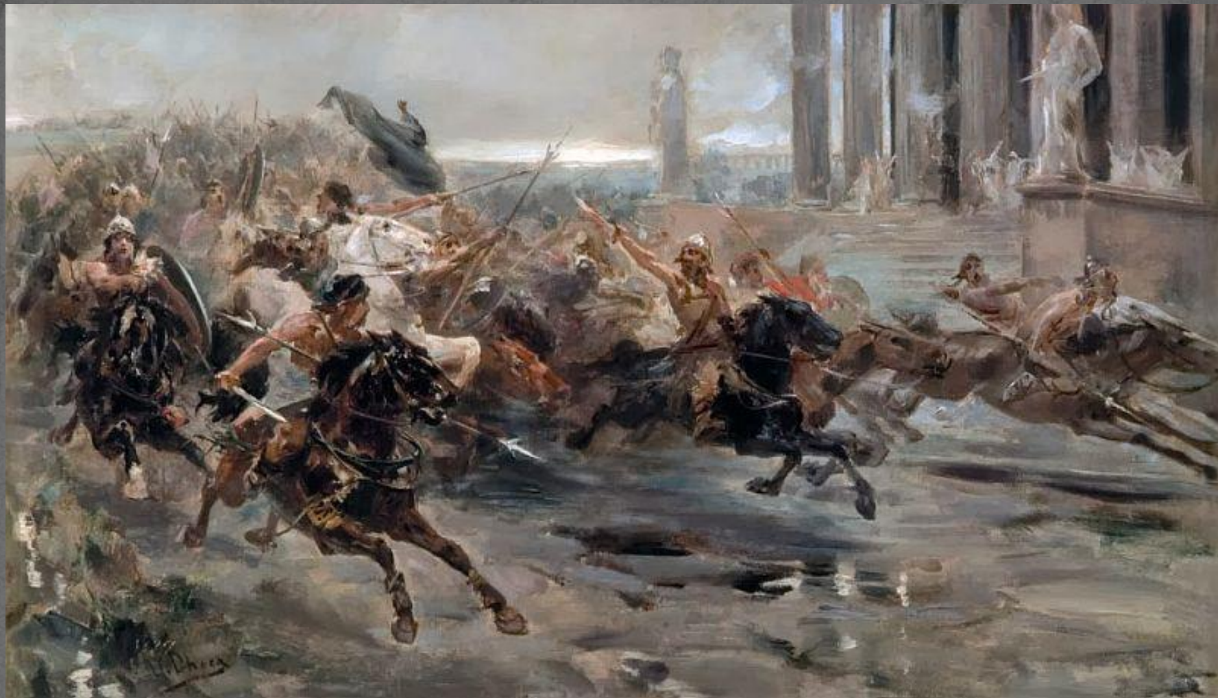
Гунны идут на Рим. Иллюстрация худ. Ульпиано Кеки