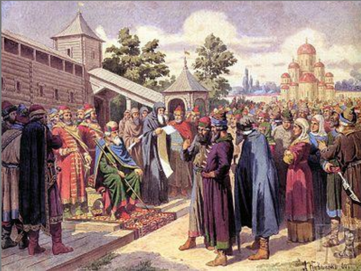
«Чтение народу Русской Правды в присутствии великого князя Ярослава»

Стремясь установить порядок в своем государстве, киевский князь создал первый на Руси письменный свод законов – «Правда Ярослава Мудрого», или «Русская правда». Этот документ предусматривал строгие наказания за убийство, оскорбление, кражу чужого имущества. Принятие единого свода законов имело огромное значение для укрепления Древнерусского государства.