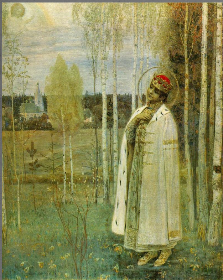
М.Нестеров. Царевич Дмитрий

Одним из важнейших дел Шуйского было назначение патриарха. Патриарх Игнатий Грек за поддержку Лжедмитрия I был лишен своего сана.