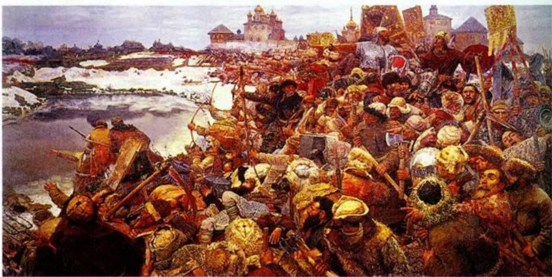
Г.Горелов. Восстание Болотникова