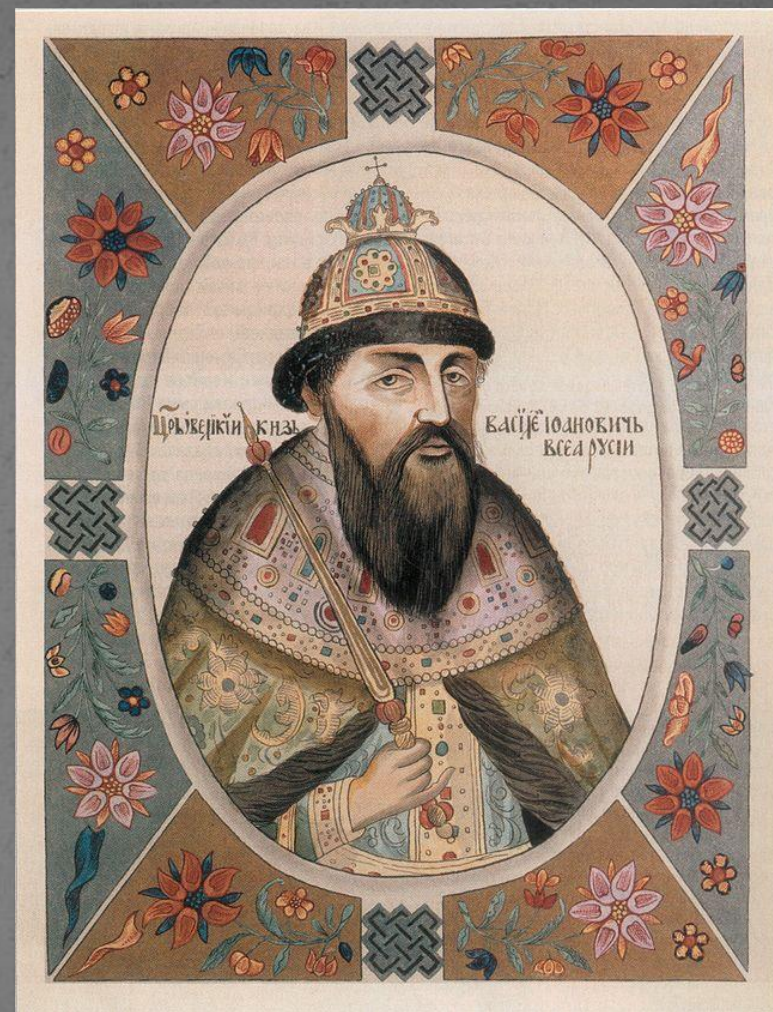
Портрет Василя IV Шуйского из «Царского титулярника» 1672 года

После смерти Лжедмитрия на престол вступил боярский царь Василий Шуйский (1606-1610) . Род Шуйских иностранцы называли «Принцами крови», он вёлся то ли от брата, то ли от сына Александра Невского и, начиная с XIII века, был приближен к престолу. Сам Василий Шуйский был жадным, коварным, жестоким человеком (осуществил два заговора), однако уважал москвичей. Восходя на престол, он дал оформленное в виде крестоцеловальной записи (целовал крест) обязательство сохранить привилегии боярства, не отнимать у них вотчин и не судить бояр без участия Боярской думы. Таким образом, власть правителя впервые в русской истории была ограничена документом . Знать теперь пыталась разрешить создавшиеся глубокие внутренние и внешние противоречия с помощью боярского царя.