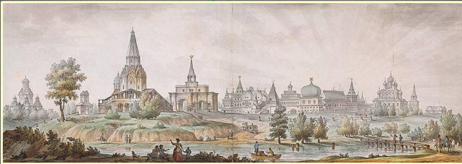
Панорама села Коломенского. XVIII в. Акварель Сухова по рисунку Кваренги

В октябре 1606 года армия Болотникова осадила Москву , расположившись у села Коломенского . В это время на стороне восставших было более 70 городов. Два месяца длилась осада Москвы. Однако в решающий момент из-за возникших разногласий между дворянскими отрядами и Болотниковым первые перешли на сторону Василия Шуйского, что привело к разгрому армии Болотникова. Добиваясь поддержки бояр и дворян, Шуйский в марте 1607 г. издал " Уложение о крестьянах ", введившее 15-летний срок сыска беглых крестьян .