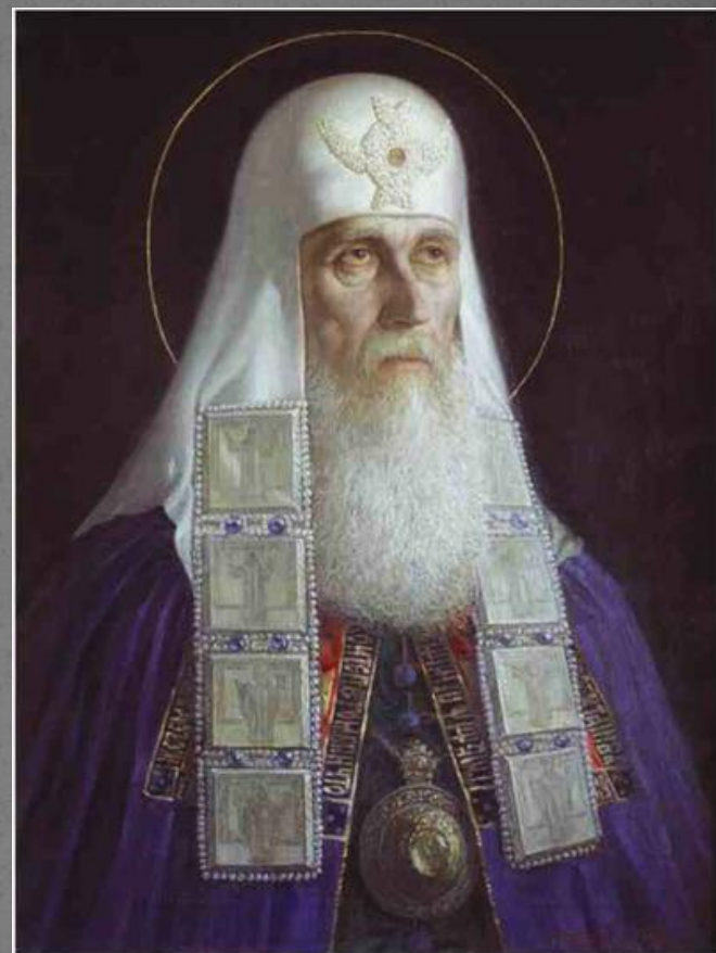
В.Шилов. Патриарх Гермоген