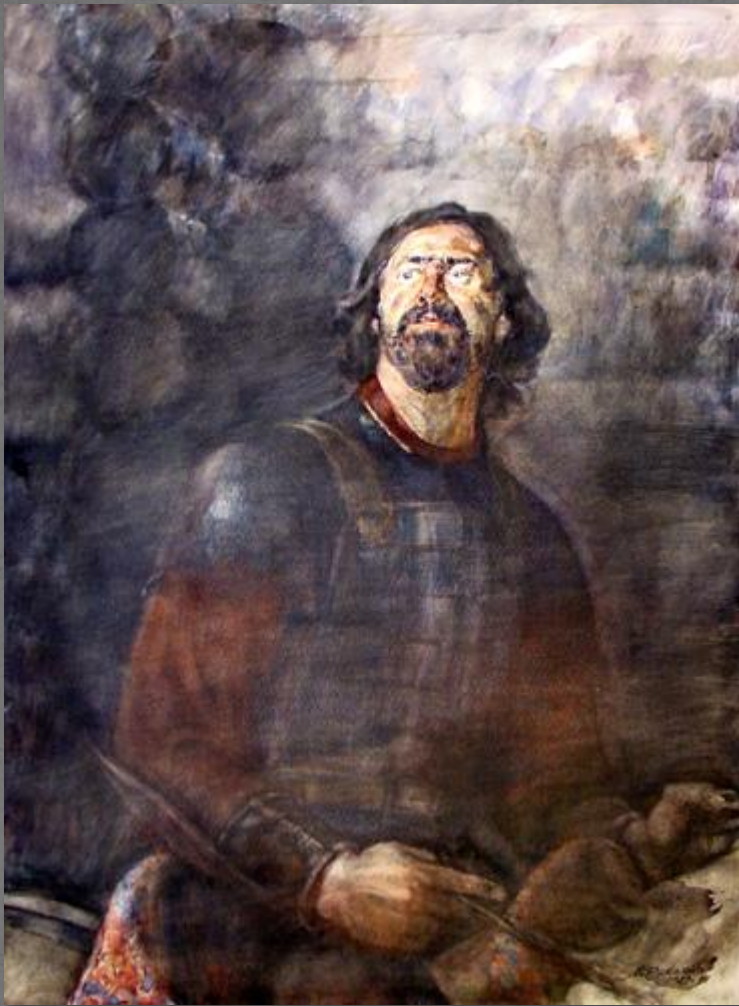
В.Рябовол. Иван Болотников. Этюд к картине

Иван Исаевич Болотников был боевым холопом (т.е. холопом, сопровождавшим своего феодала на войне) князя Телятевского . От него он бежал к донским казакам, был захвачен в плен крымскими татарами и продан в рабство в качестве гребца на турецкую галеру. После разгрома турецкого флота немецкими кораблями Болотников оказался в Венеции, откуда через Германию и Польшу попал в Путивль .