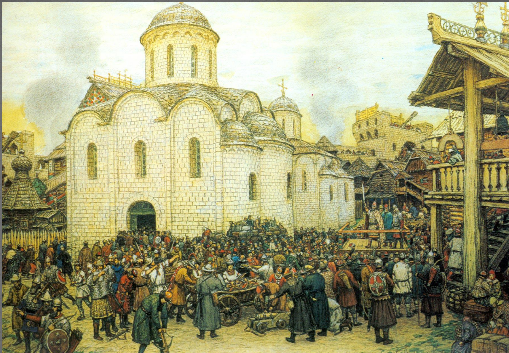
А.М.Васнецов. Оборона Москвы от хана Тохтамыша