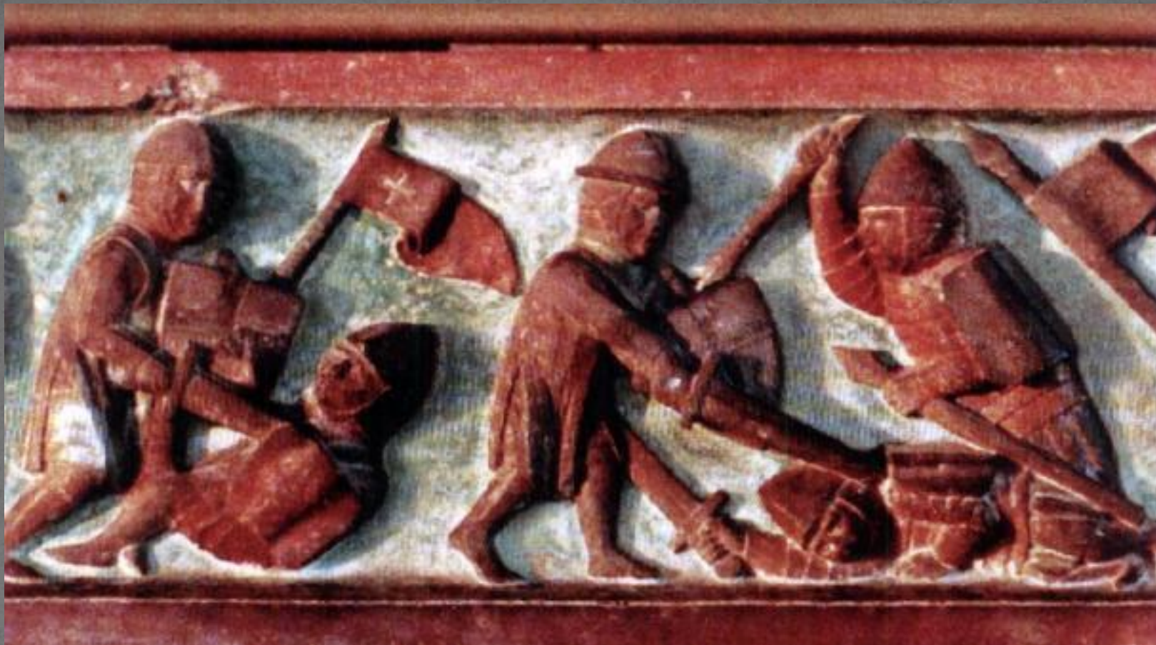
Литовцы сражаются с тевтонскими рыцарями; фреска с замка Мариенбург, середина XIV столетия