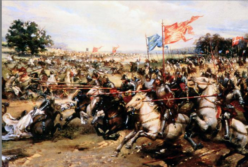
Гавриил Ващенко. Грюнвальдская битва

В это время польские войска стояли на месте и наблюдали за сражением, а польский король Ягайло слушал обедню и бездействовал. Крестоносцы не преминули воспользоваться подходящим моментом и нанесли удар в центр, с целью взять в два отдельных кольца войска ВКЛ и Польши. В это время войска Витовта на правом фланге начали отступать, и сражавшиеся с ними тевтонцы, решив, что литвины бегут, ринулись за ними к обозам, но там, встретили упорное сопротивление.