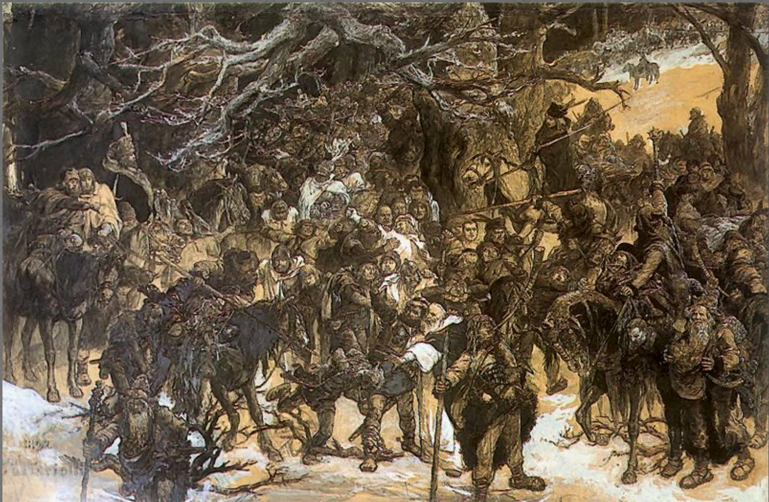
Михал Эльви́ро Андриолли. Возвращение литовцев, 1892. Национальный музей Варшавы.