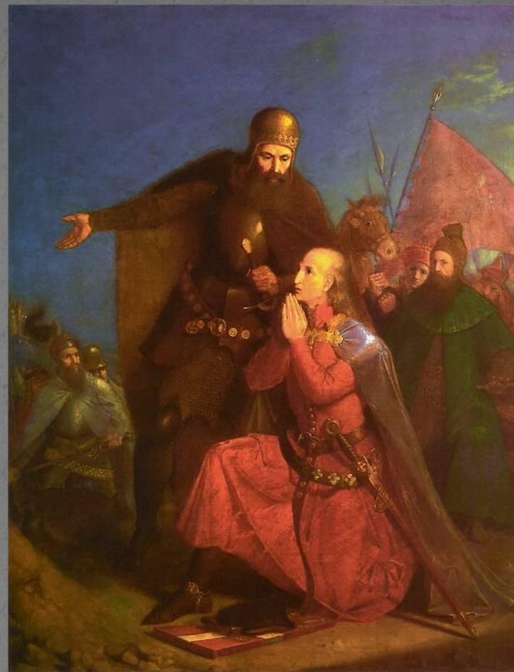
«Владислав Ягайло и Витовт молятся перед битвой», картина Яна Матейко

Тевтонский орден под свои знамёна собрал приблизительно 18000 солдат , на помощь к крестоносцам приехали рыцари из многих европейских стран. В итоге, в войско тевтонов вошло 22 нации.