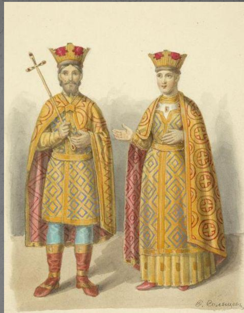
Василий I и Софья Витовтовна

На рубеже XIV-XV вв. отношения Руси с Ордой осложнились. В 70-х гг. XIV в. один из мелких среднеазиатских правителей Тимур (в европейской транскрипции – Тамерлан) начал завоевание Средней Азии, а на рубеже 80-90-х годов подчинил себе Золотую Орду и разгромил хана Тохтамыша.