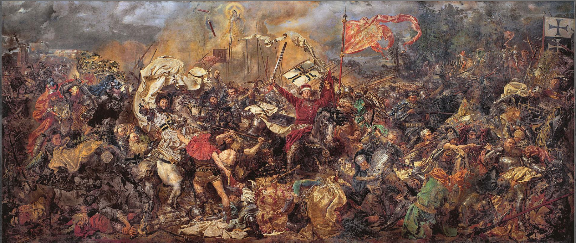
Ян Матейко. «Грюнвальдская битва»