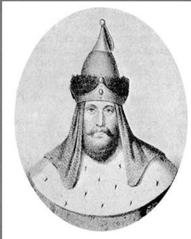
Василий I Дмитриевич