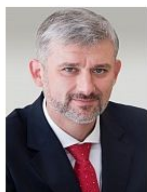
Дитрих Евгений Иванович