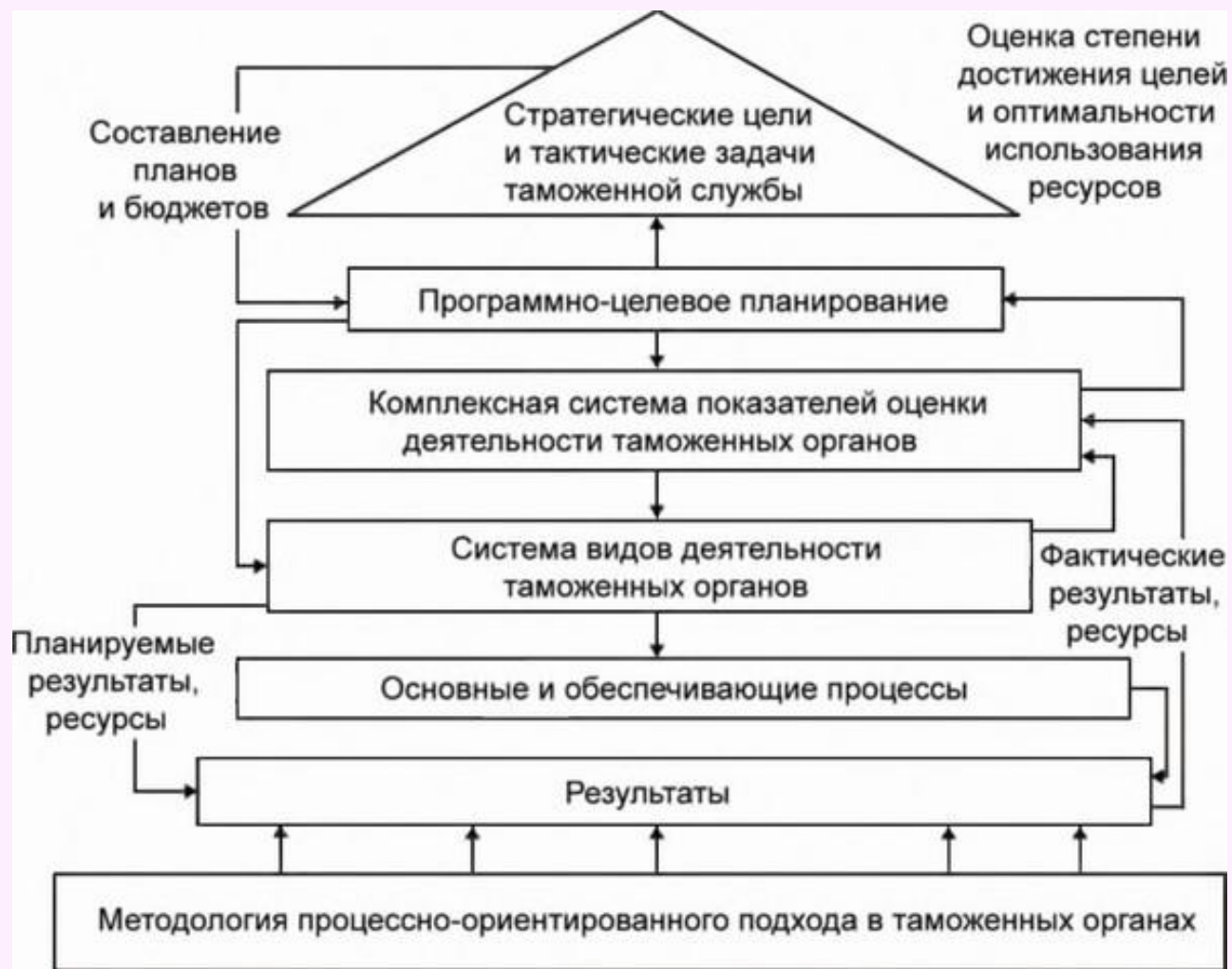
Рис.3 Основы процессно-ориентированного подхода в таможенных органах