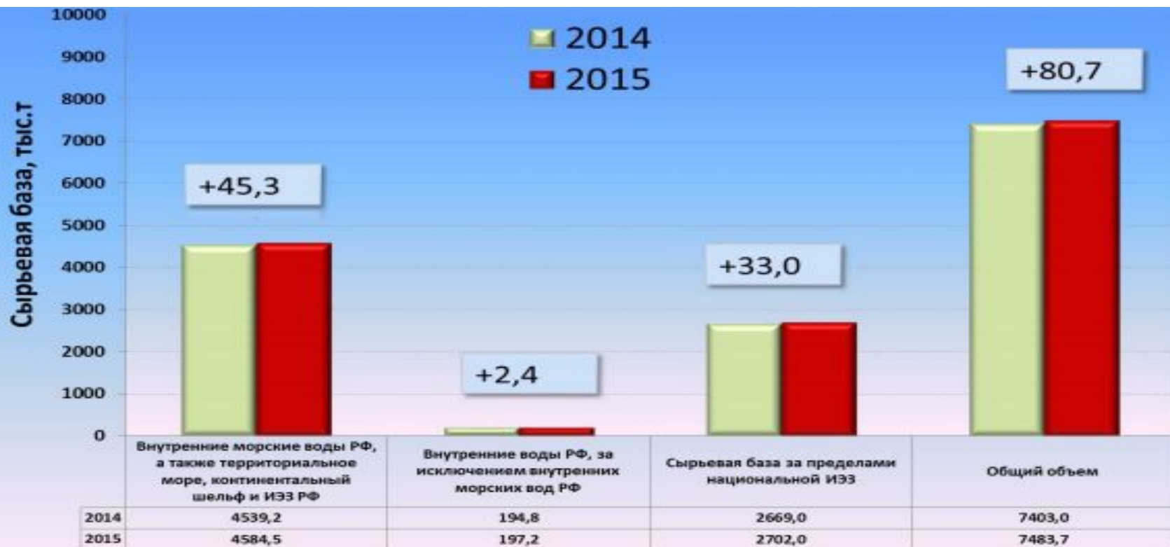
Рис. 1. Общий объем сырьевой базы, доступной для отечественного рыболовства в 2014, 2015 годах, тыс. т.

Общий объем сырьевой базы, доступной для отечественного рыболовства как за пределами зоны российской юрисдикции, так и в ее пределах в 2015 году достиг объема 7483,7 тыс. т. Из них, в пределах российской юрисдикции сырьевая база оценивается в количестве 4781,7 тыс.т, за пределами национальной исключительной экономической зоны – 2702,0 тыс.т