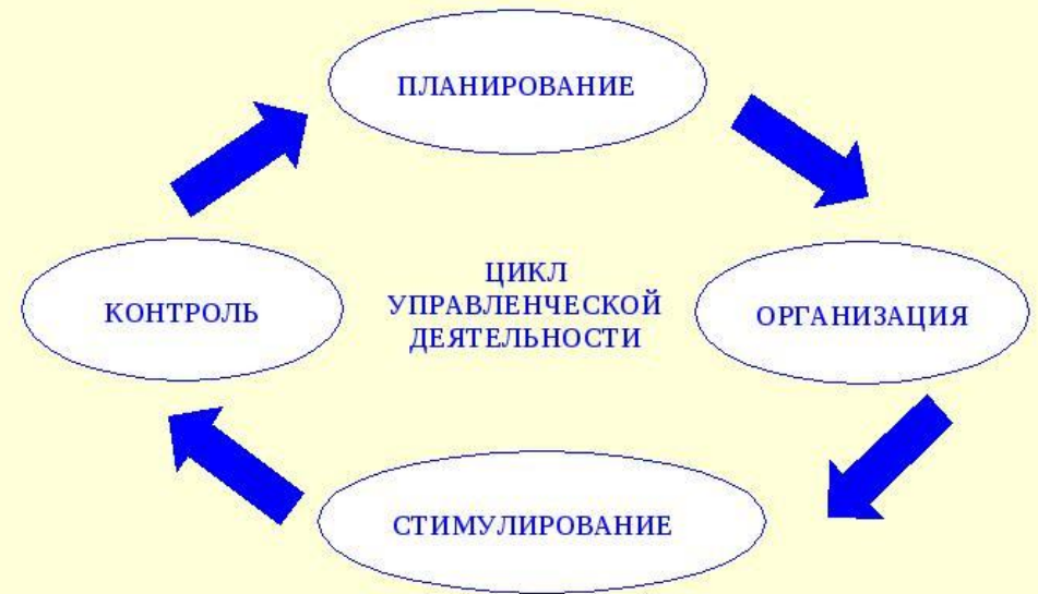
Цикл управленческой деятельности