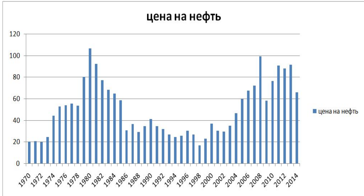
ЦЕНЫ НА НЕФТЬ (в долларах 2013 года)