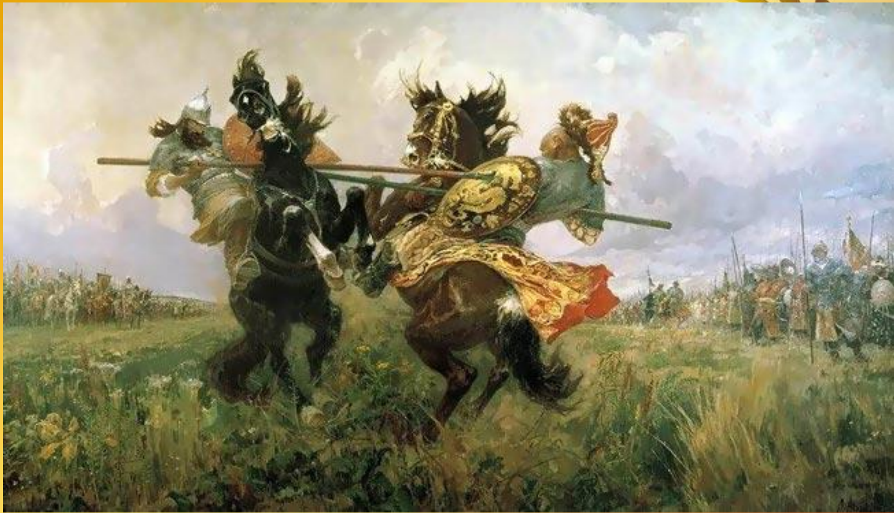
В. Васнецов «Поединок Пересвета с Челубеем»