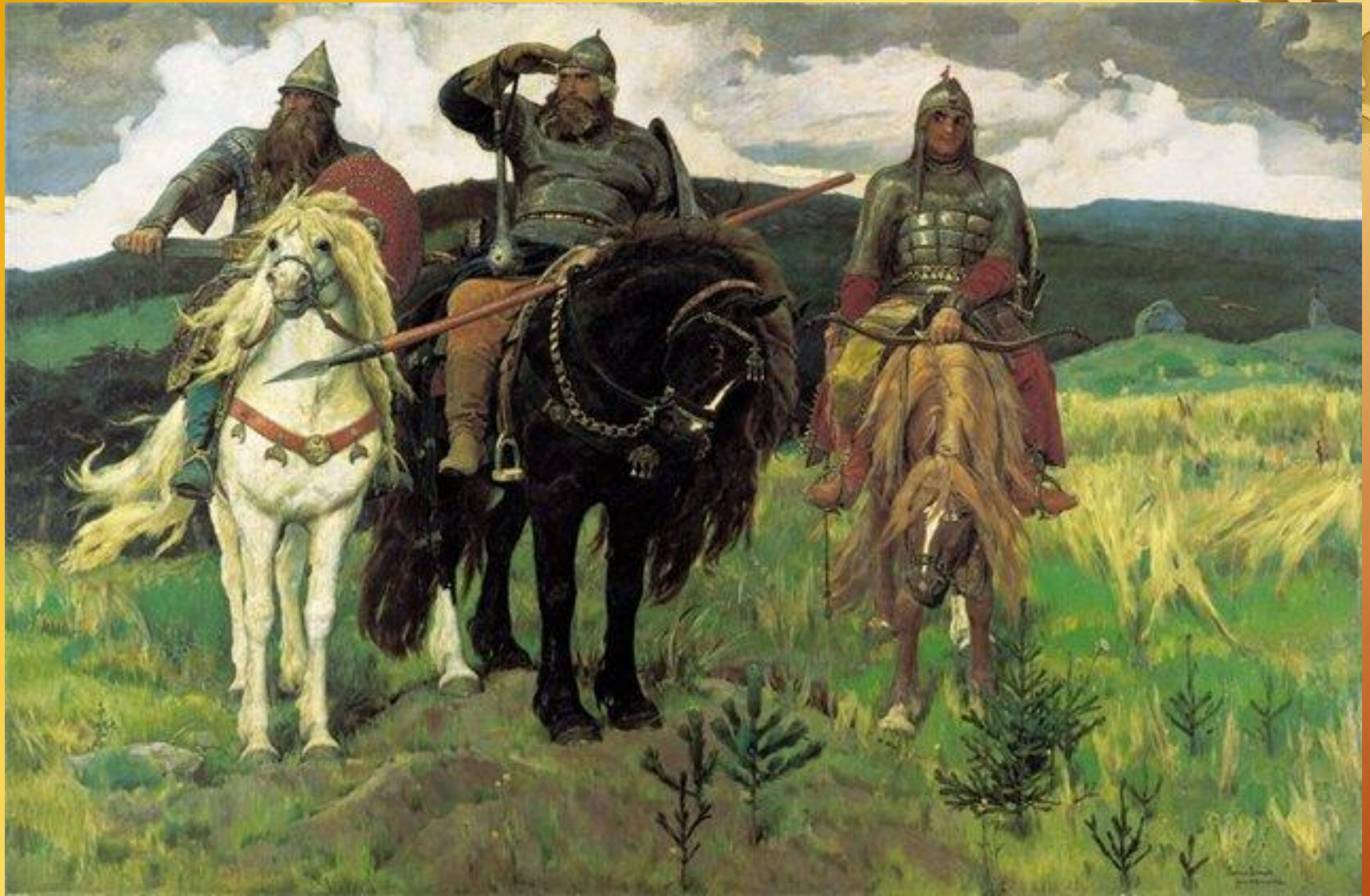
В. Васнецов «Богатыри»