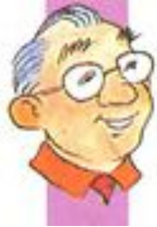
a grand father