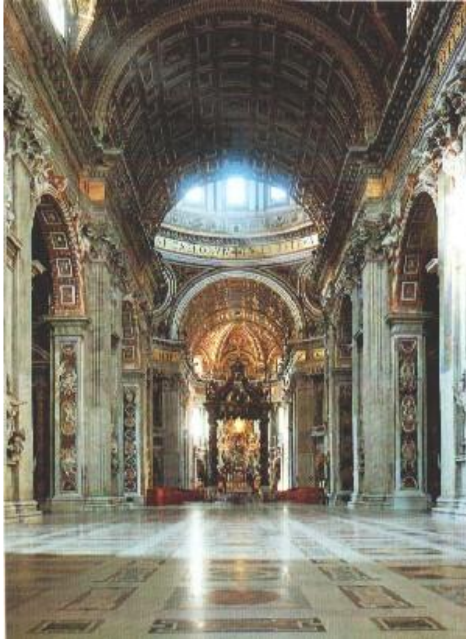
Внутренняя отделка базилики