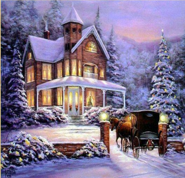
Devant la maison