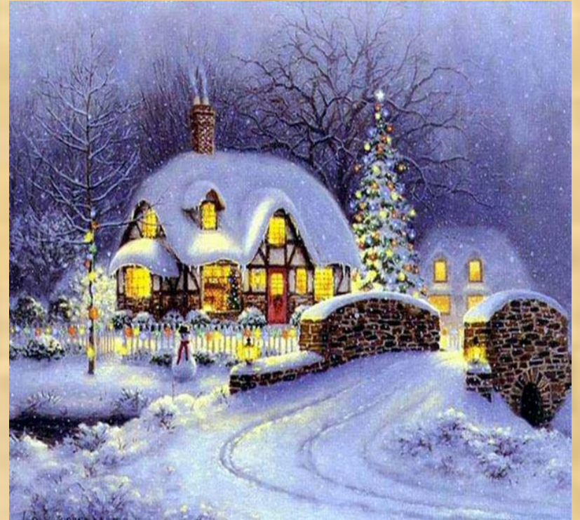
Derrière la maison