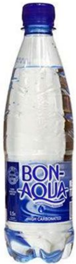
a bottle of water