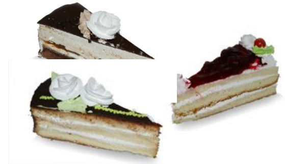
three pieces of cake