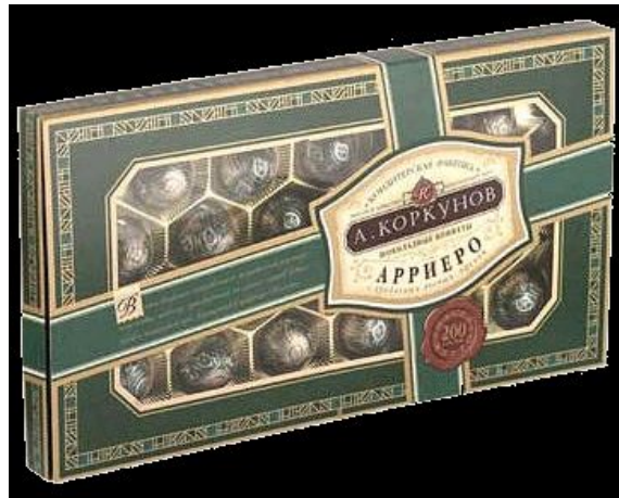
a box of chocolates