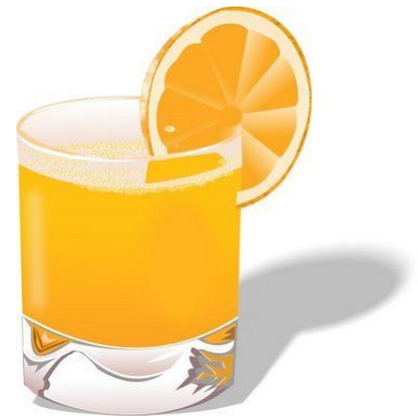
a glass of orange juice