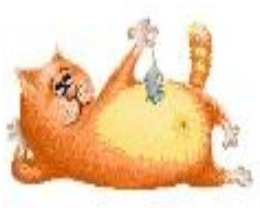
Иллюстрация к стихотворению “Pussy Cat, Pussy Cat? Where have you been?”