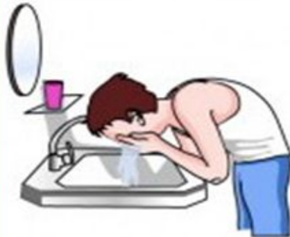
wash your face