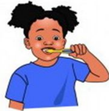
brush your teeth