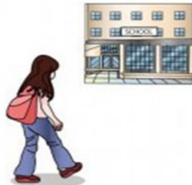
go to school