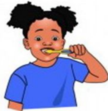
brush your teeth