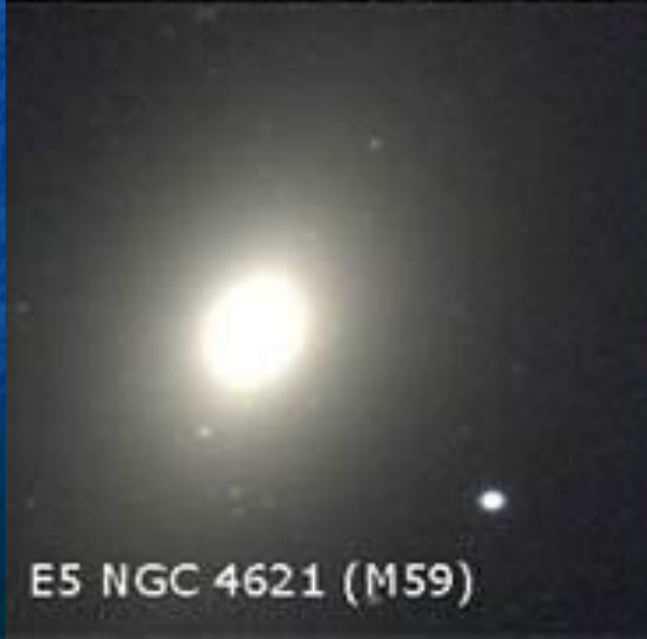
E5 NGC 4621 (M59)