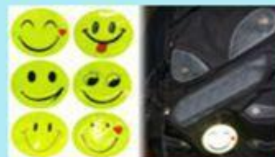
Комплект наклеек светоотражающих