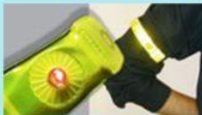
Браслет на предплечье