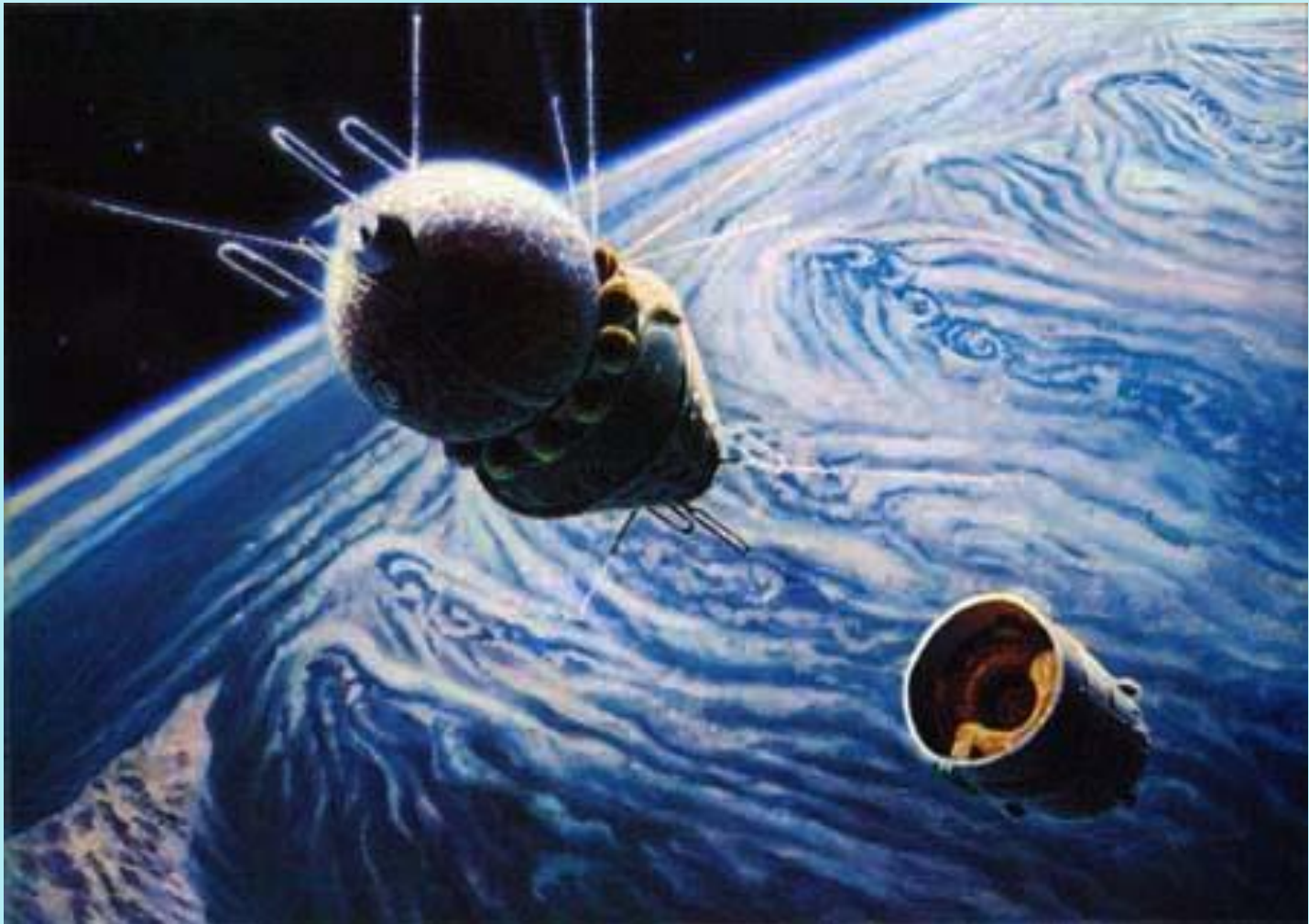
А.Соколов «ВОСТОК» ВЫШЕЛ НА ОРБИТУ