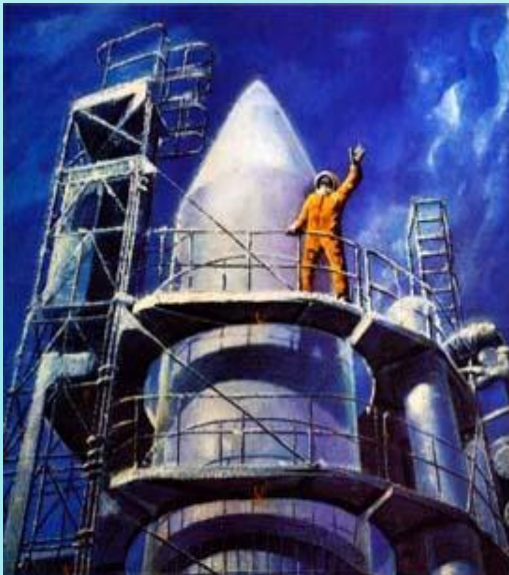
А. Леонов, А. Соколов ПЕРЕД СТАРТОМ