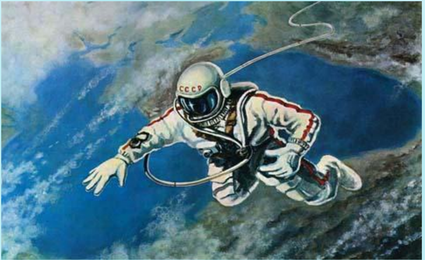
А. Леонов НАД ЧЕРНЫМ МОРЕМ