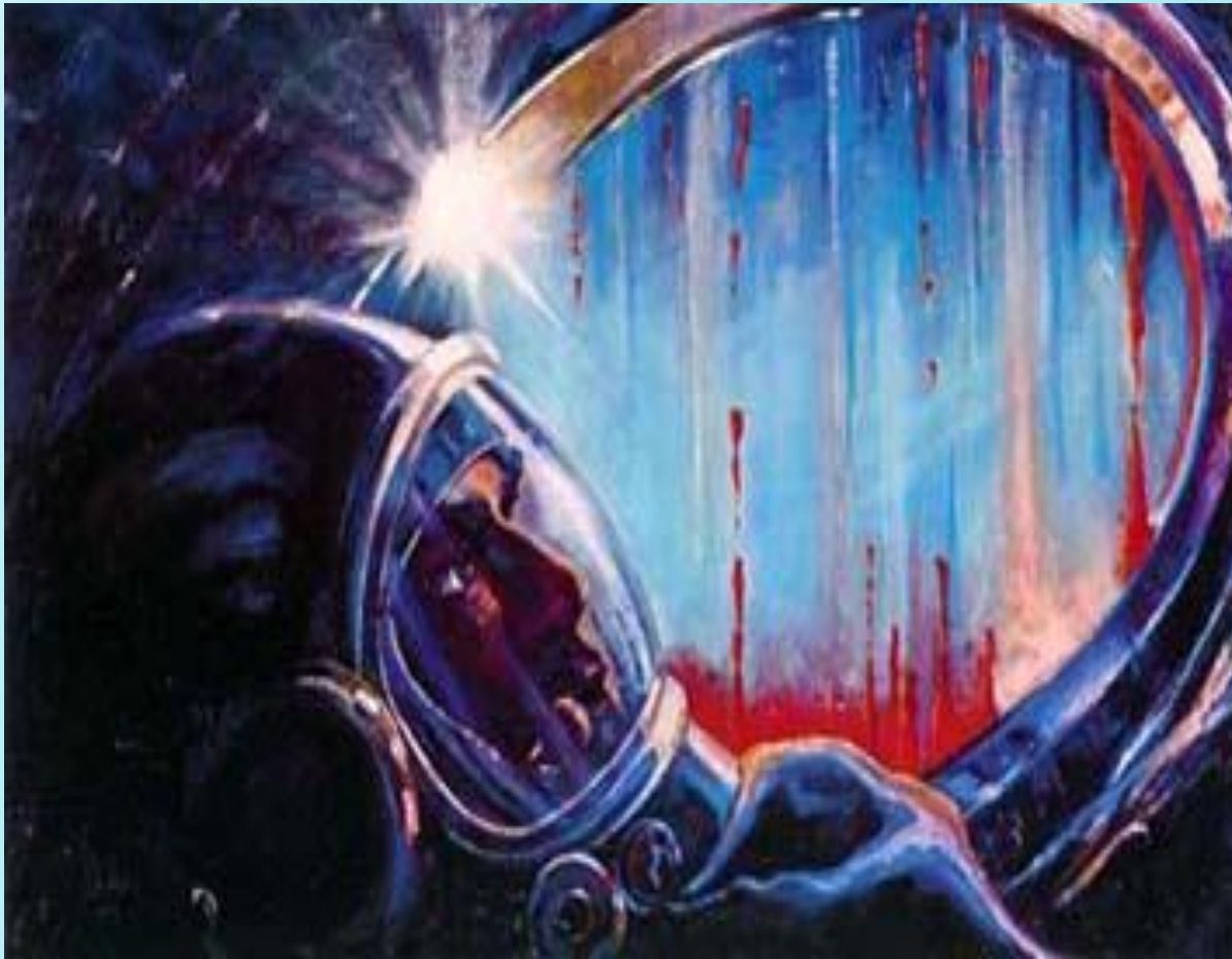
А. Леонов ВПЕРЕДИ ЗЕМЛЯ

За стеклом иллюминатора - капли раскаленного металла срываются с покрытия корабля, огромная перегрузка искажает лицо космонавта. Скоро приземление