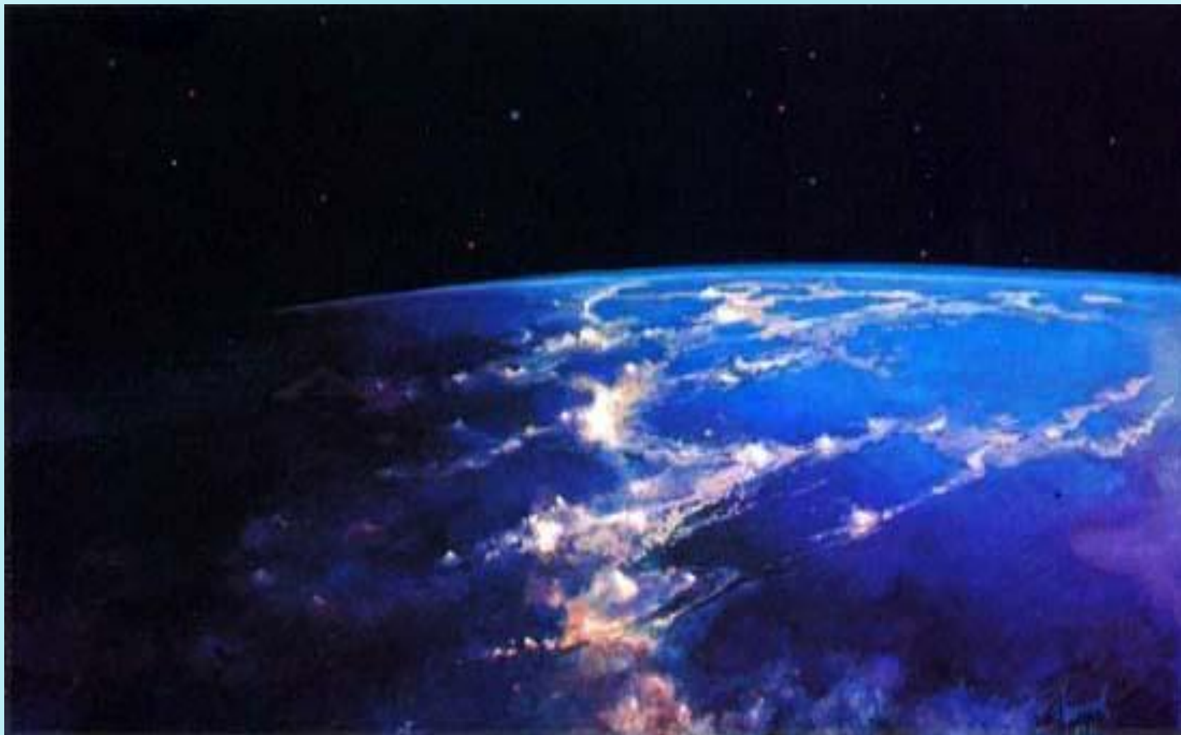
А. Леонов НАД ТЕРМИНАТОРОМ