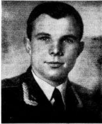
ЮРИ АЛЕКСАНДРОВИЧ ГАГАРИН