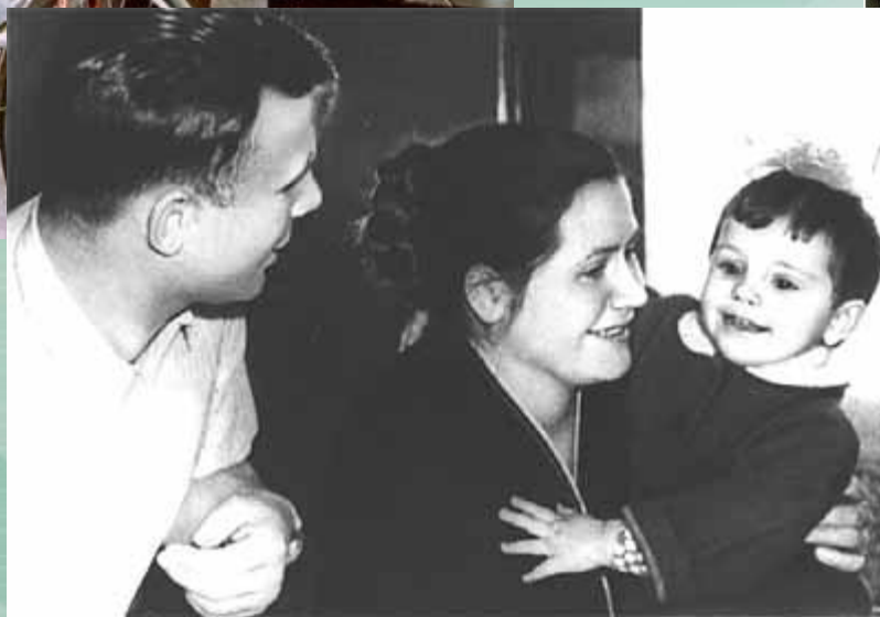
Ю.А. и В.И. Гагарины с дочкой Леной