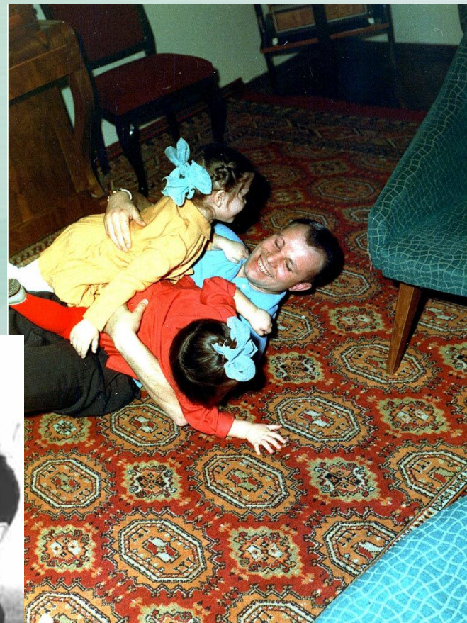
Гагарин с дочерьми Галей и Леной, Звездный городок, 1963 год