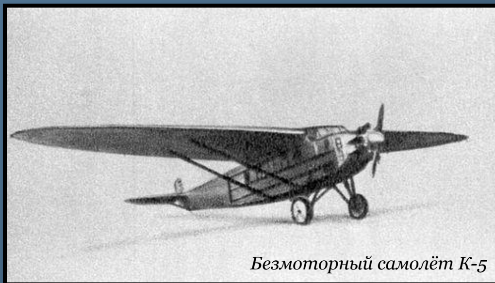
Безмоторный самолёт К-5

Поступив в 1924 году в Киевский политехнический институт по профилю авиационной техники, Королёв за два года освоил в нём общие инженерные дисциплины и стал спортсменом-планеристом. Осенью 1926 года он переводится в Московское высшее техническое училище (МВТУ) имени Н. Э. Баумана.