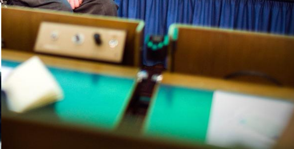
Физик-теоретик на лекции в Белом доме