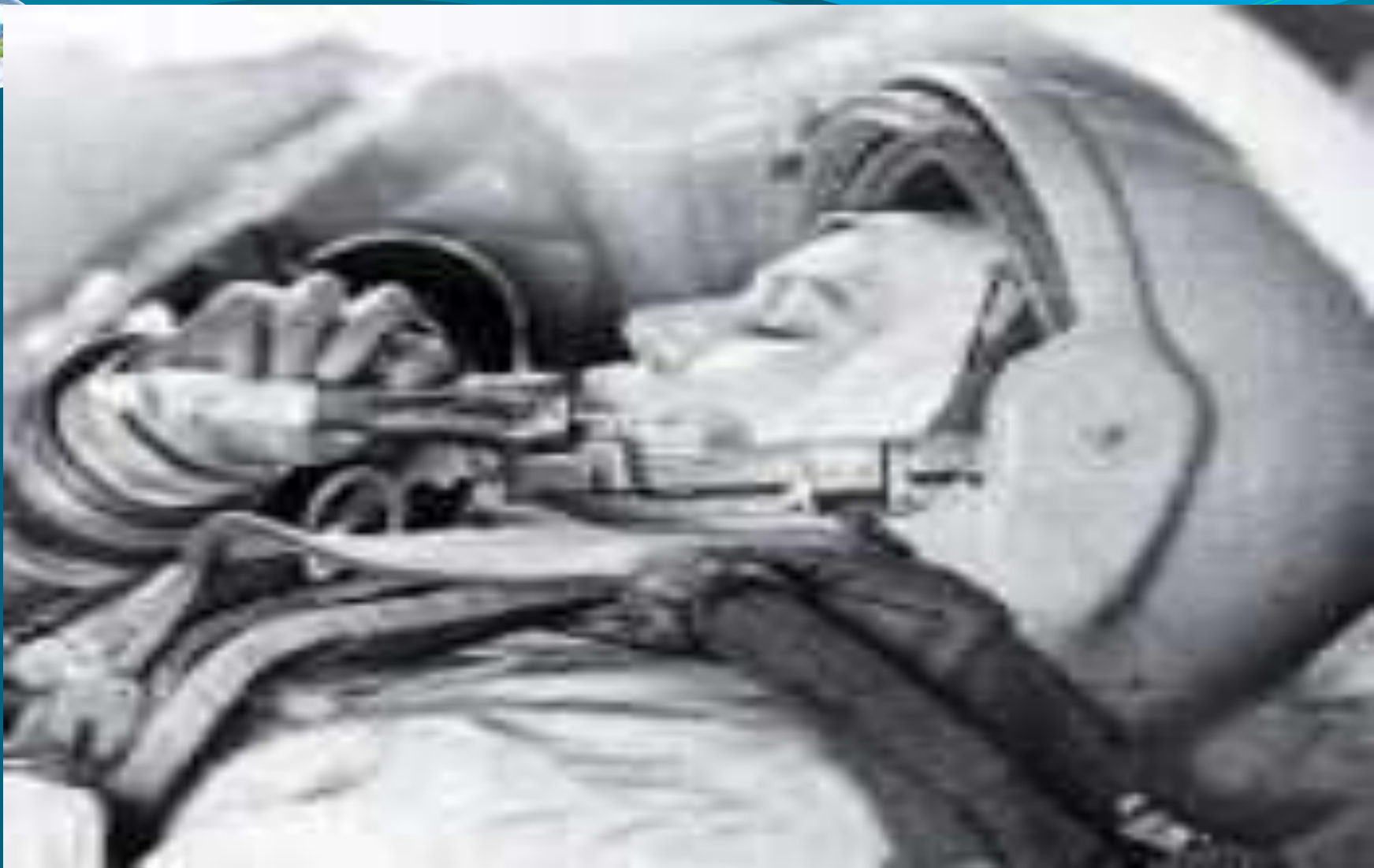
Валентина Терешкова принимает пищу из тубы