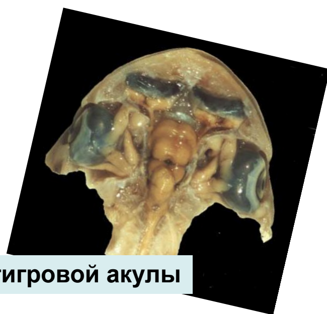
Мозг тигровой акулы