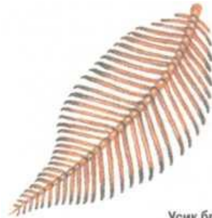
Усик бражника (самца)