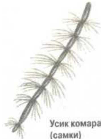
Усик комара (самки)