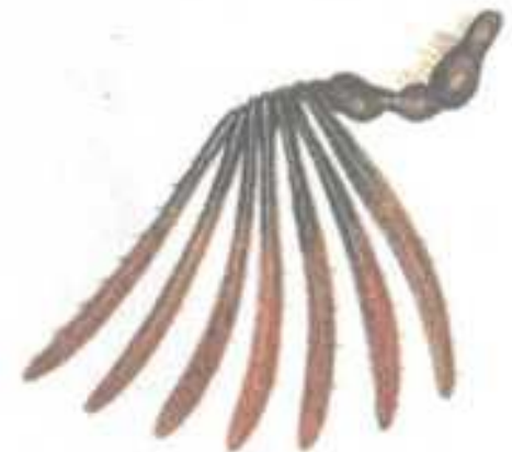
Усик майского жука