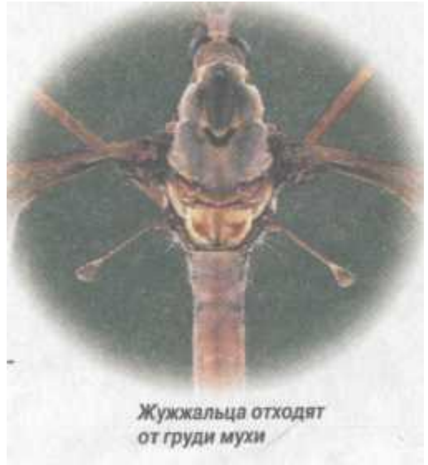
Жужжальца отходят от груди мухи