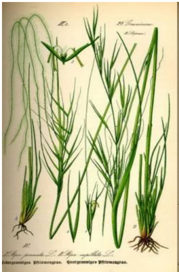
Слева: (А) Ковыль перистый; (В) Ковыль...

Кроме полевых культур, к семейству злаков относят дикорастущие травы, например пырей ползучий, тимофеевку луговую, ковыли.