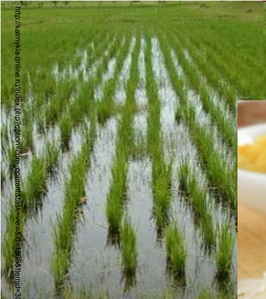
Рис - ценная зерновая культура. Его выращивают в южных районах на поливных землях.