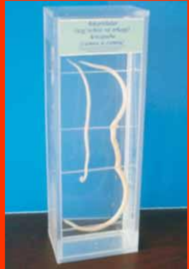
Влажный препарат аскариды

Скорость размножения и плодовитость колоссальны. Например, самка аскариды ( Ascaris lumbricoides ) способна отложить в день до 200 тыс. яиц.