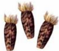
Плоды лопуха (репейника)