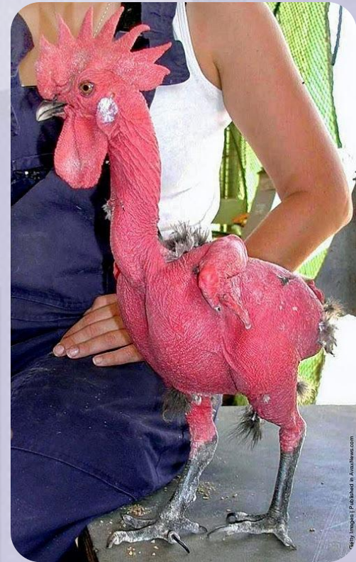
Отсутствие перьевого покрова