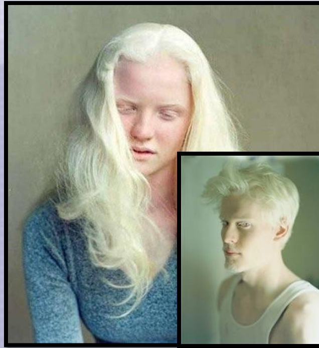
Альбинизм (отсутствие пигмента)

Явные мутации - это те мутации, которые проявляются внешне, но не наносят вреда организму.